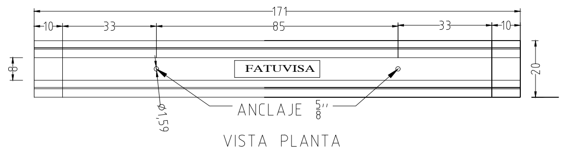
2 VISTAS DE PLANTA Y LATERAL